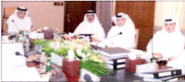
الوزير العازمي ترأس اجتماع مجلس إدارة «التطبيقي»

المضف: 17505 مقاعد للطلبة في خطة القبول 2019 - 2020