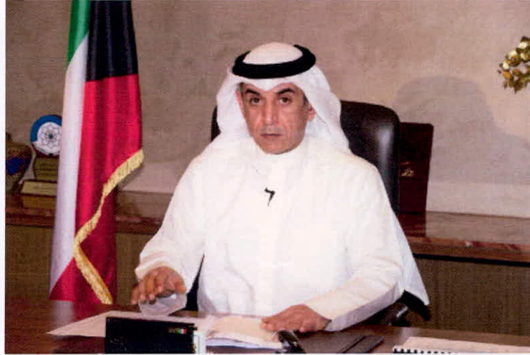
وزير التربية ووزير التعليم العالي دحامد العارمي